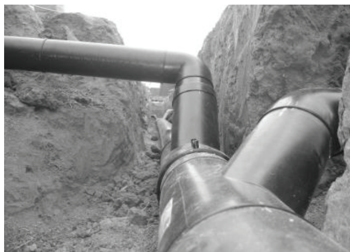
Illusztrációs felvétel: kanalizáció félkész állapotában