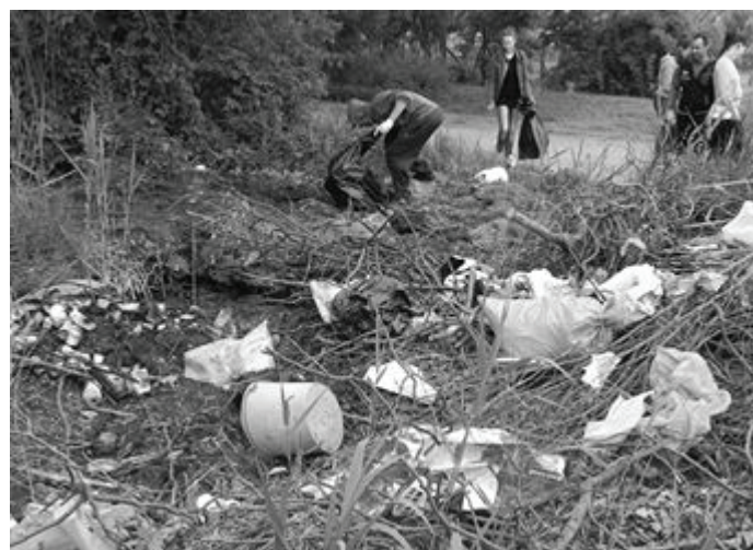
Felvétel: A LION KK munka közben a "szöllösöknél".