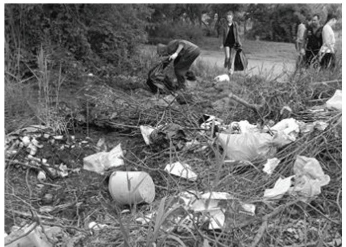
Felvétel: A LION KK munka közben a "szöllösöknél".