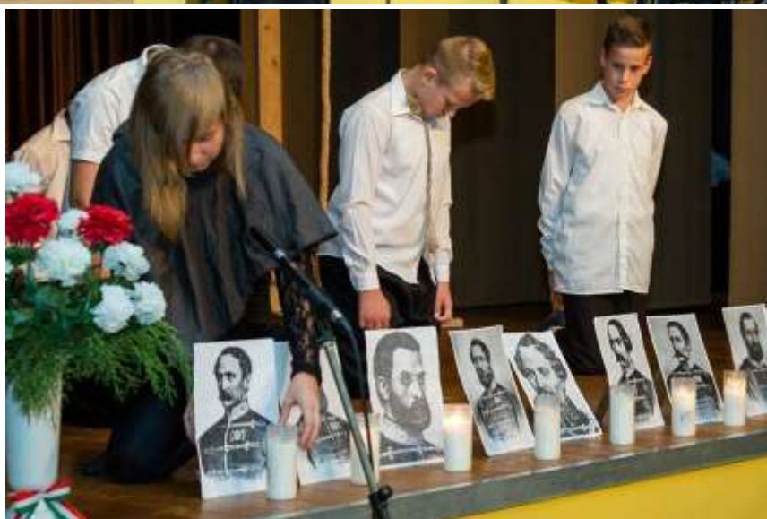
Szerkesztette Nagy Amália, Mgr. Nagy Edit