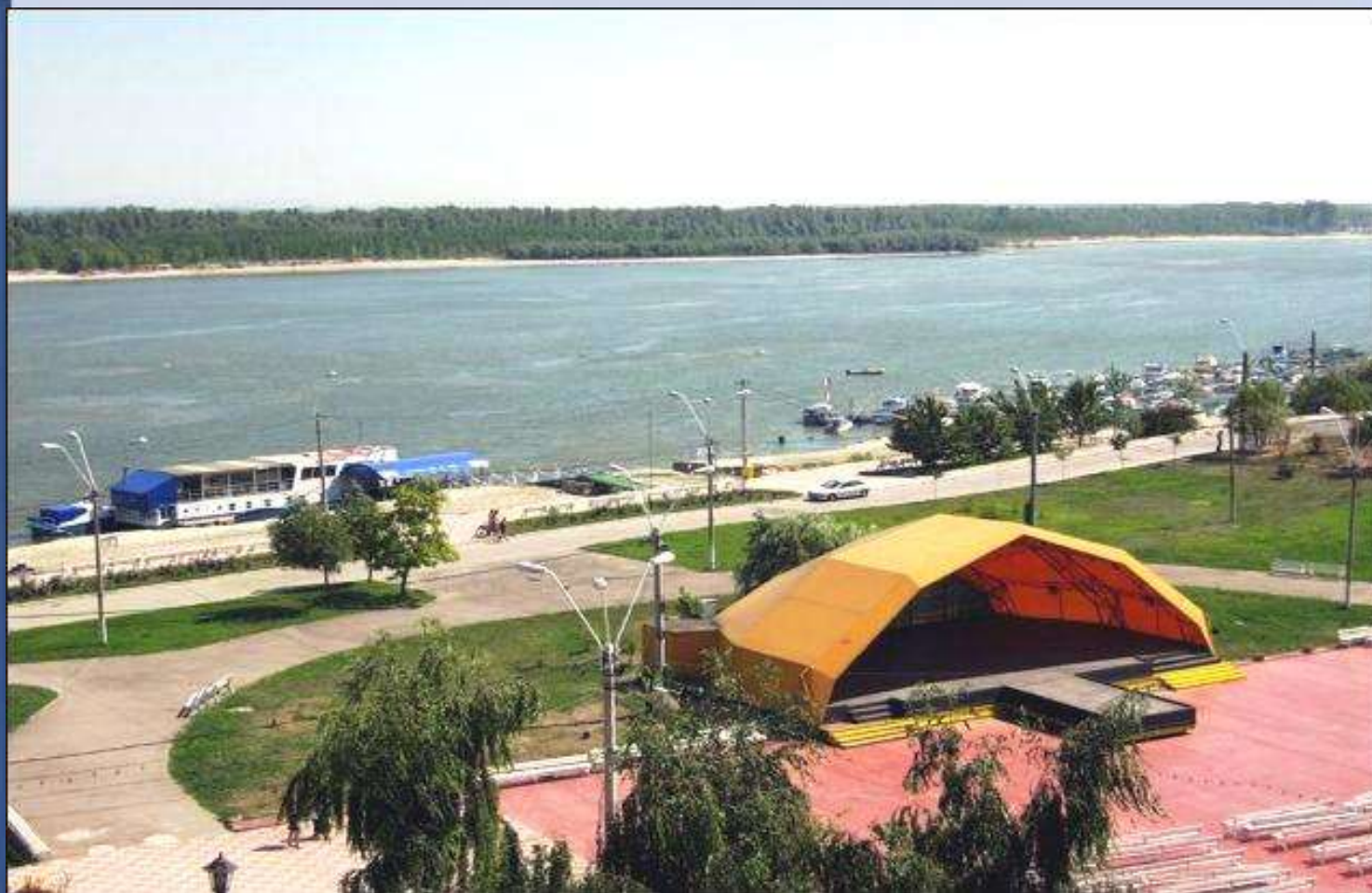
Vissza Romániába, Braila