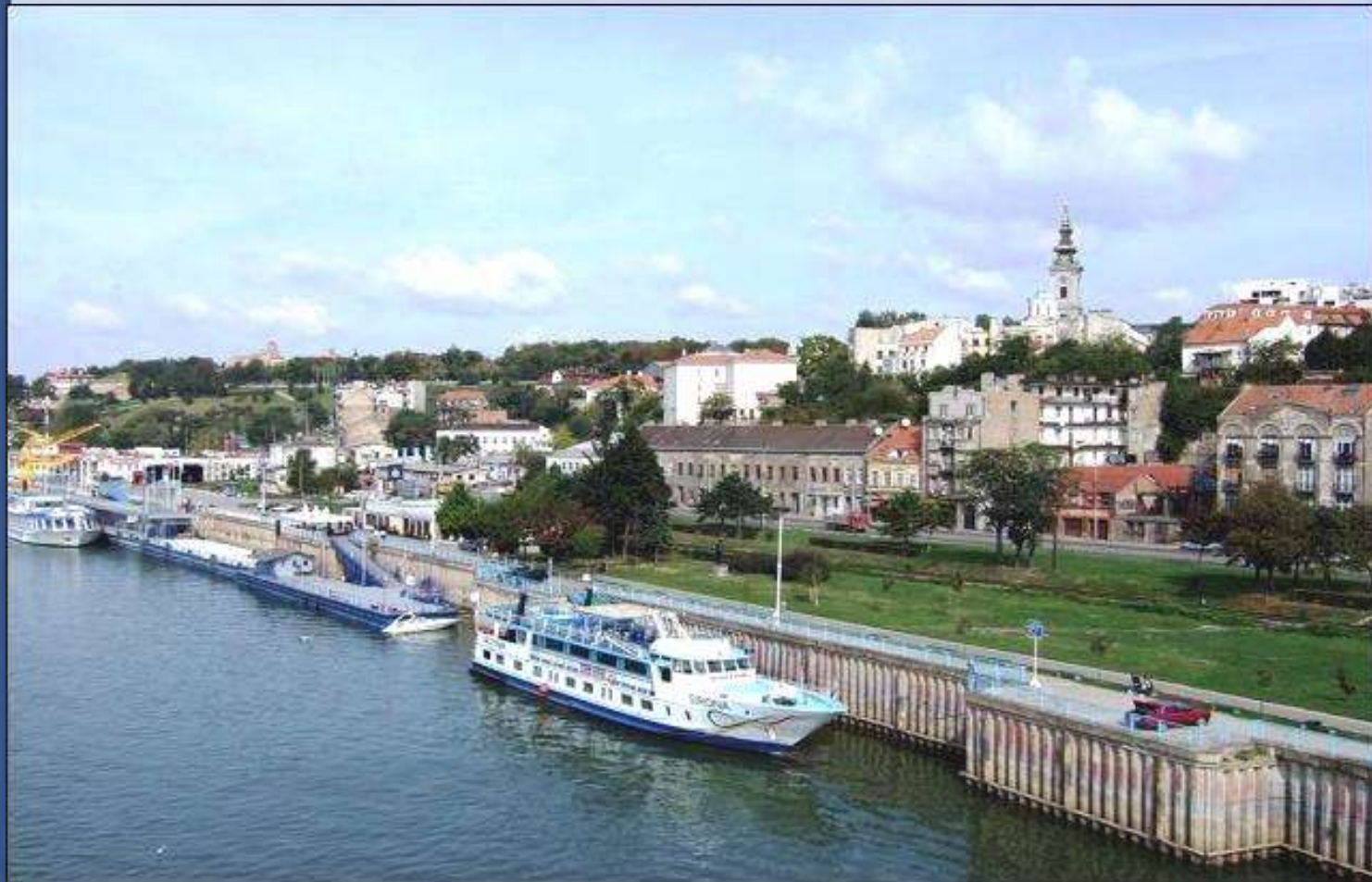
Kikötő Belgrádnál (Szerbia fővárosa)