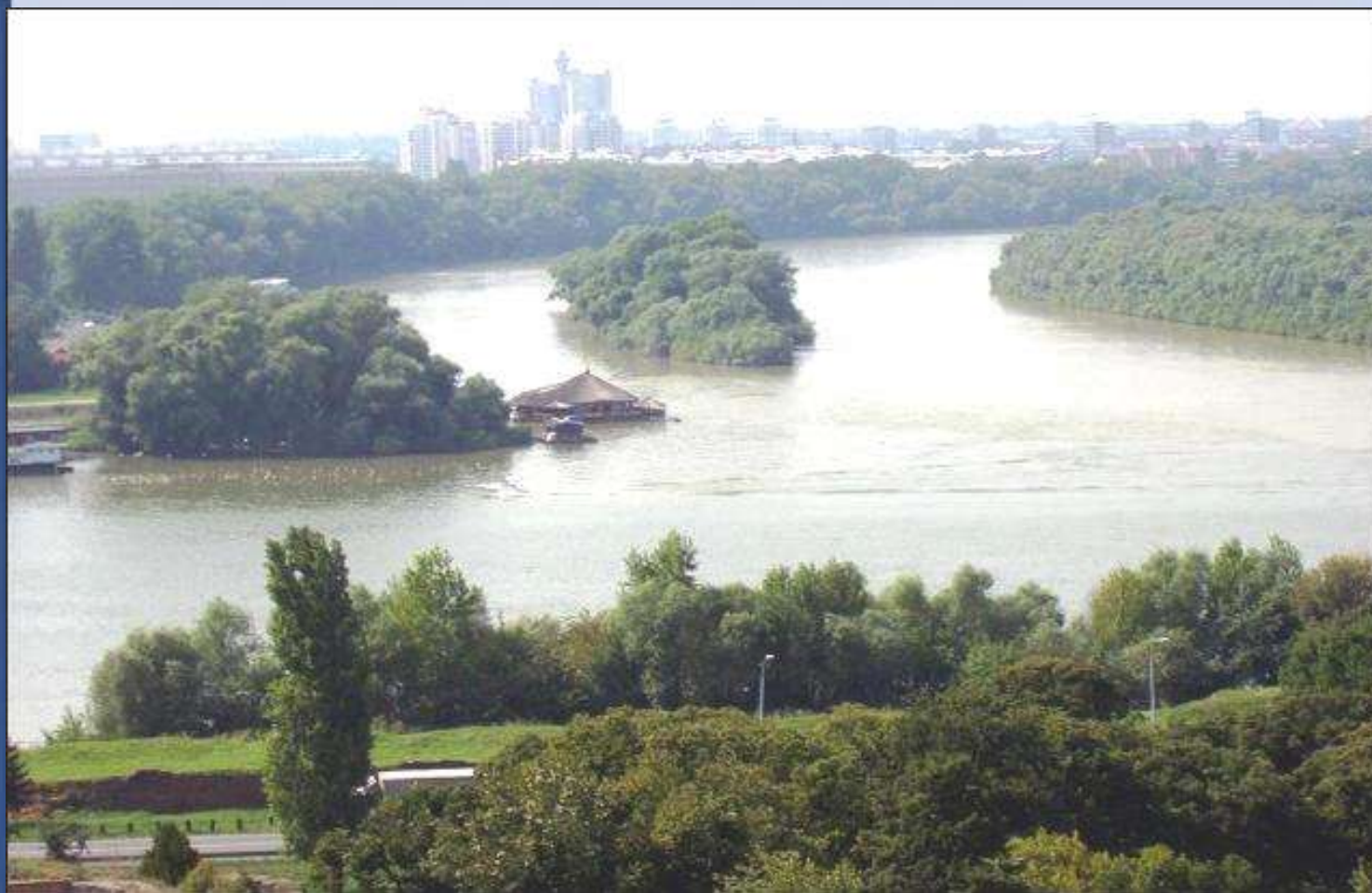
A Száva becsatlakozása a Duna jobb partján, Belgrádnál (Szerbia)