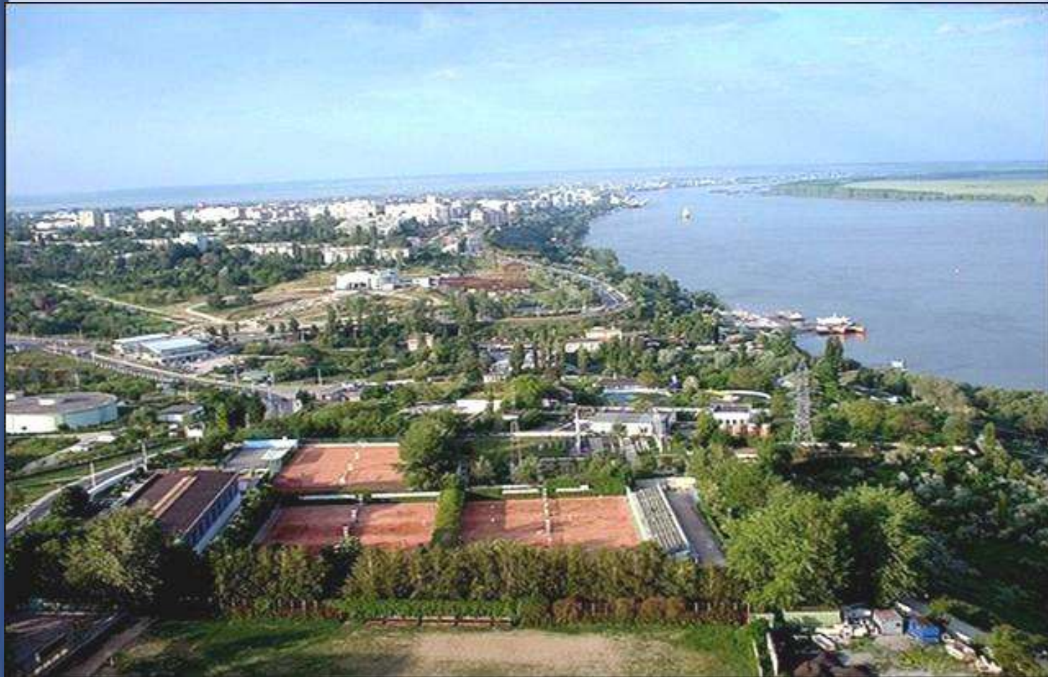
Galac (Galati , Románia)