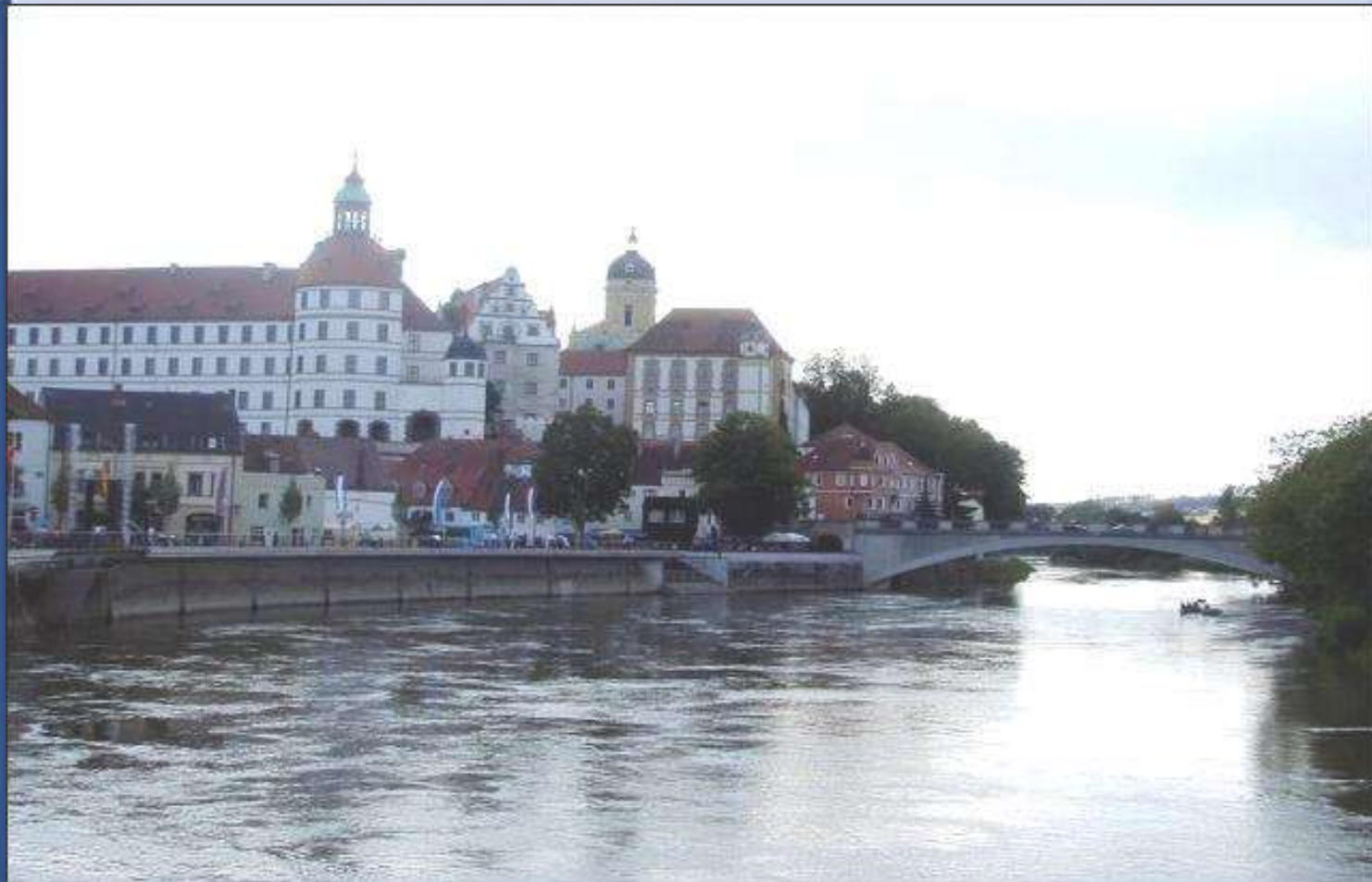
Szűkület Ingolstadt –nál (Németország)