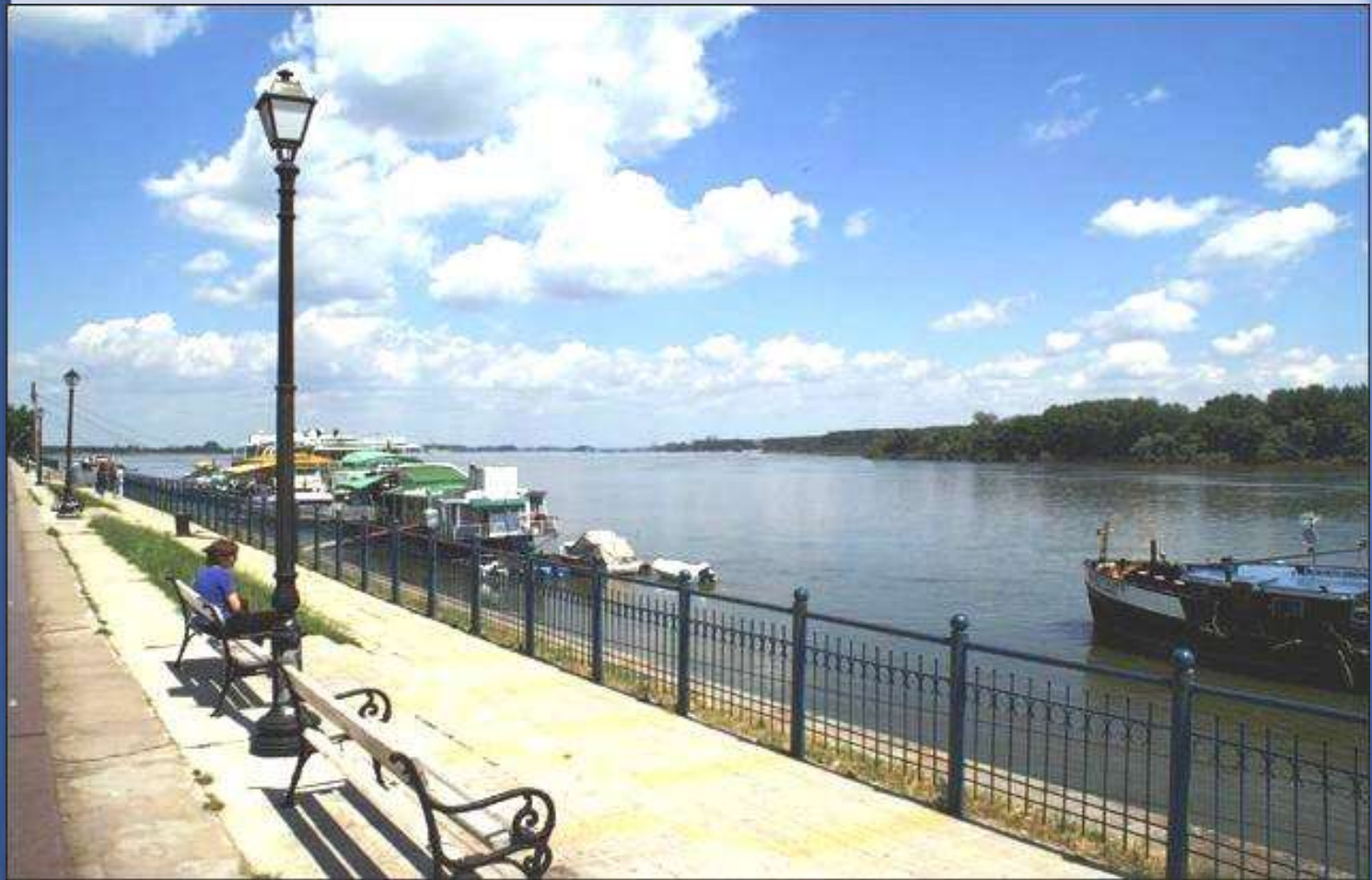
Bulgária határán, Vidin