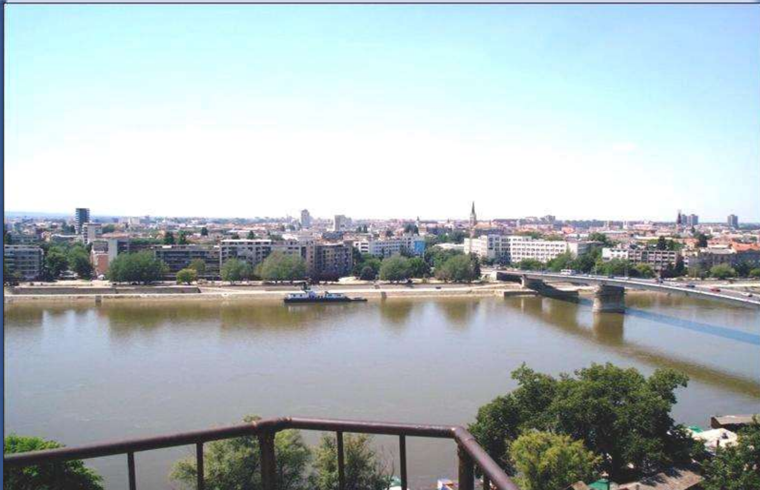
Újvidék (Novi Sad – Szerbia)