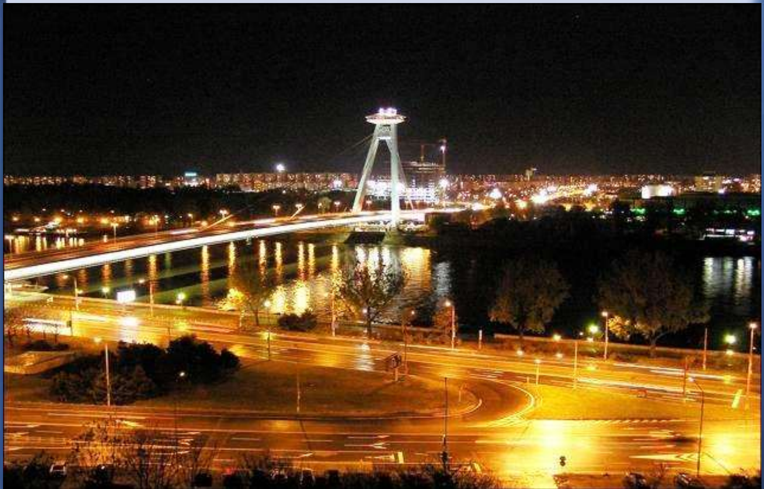
Pozsony (Bratislava – Szlovákia)