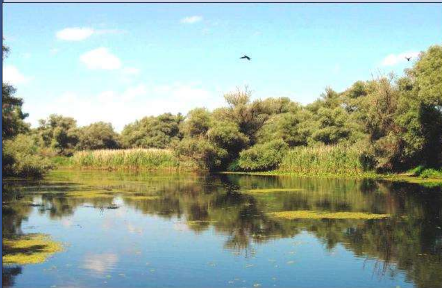
Floresta Letea, a deltavidék kezdete