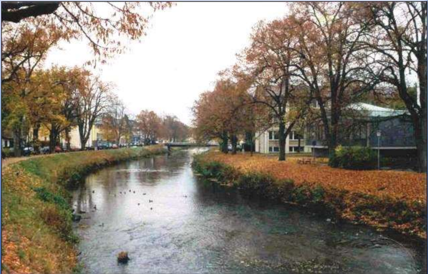
Donaueschingen, a Duna