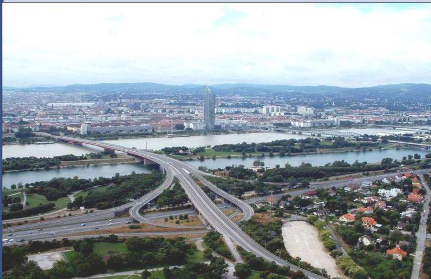
Bécs (Wien) Ausztria fővárosa