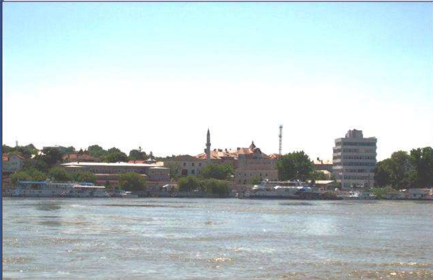
Tulcea, irány a tenger