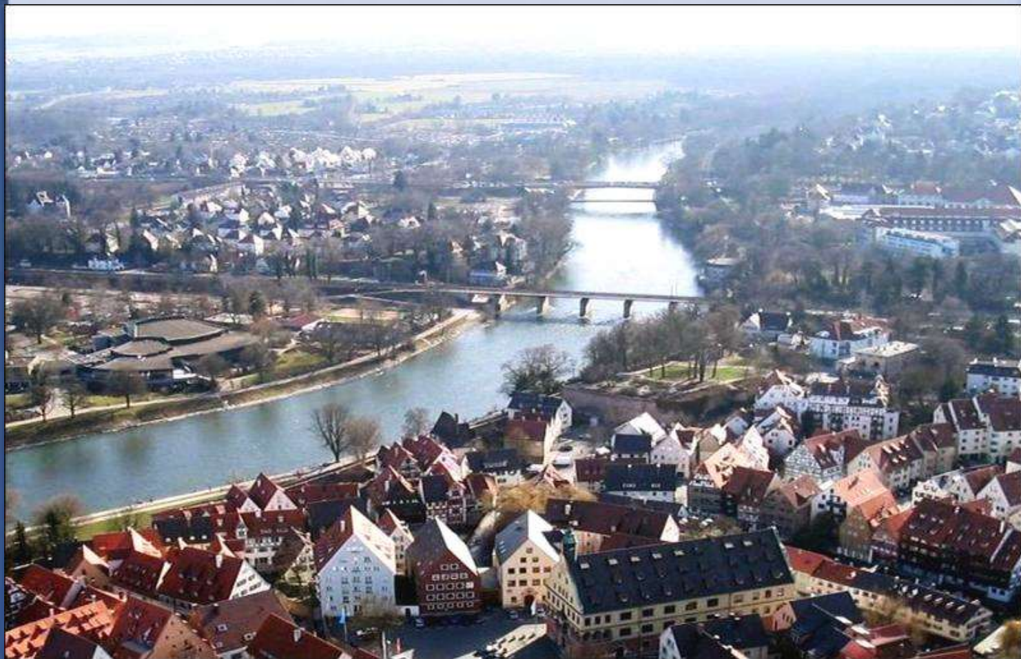
A Duna Ulm-nál (Németország)