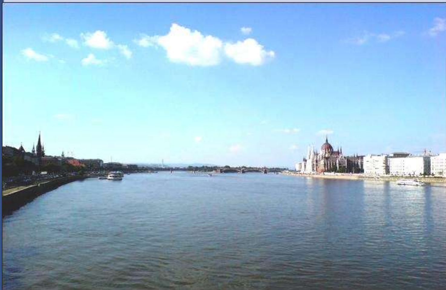
Az igazi „nagy folyó”, Budapest (Magyarország)