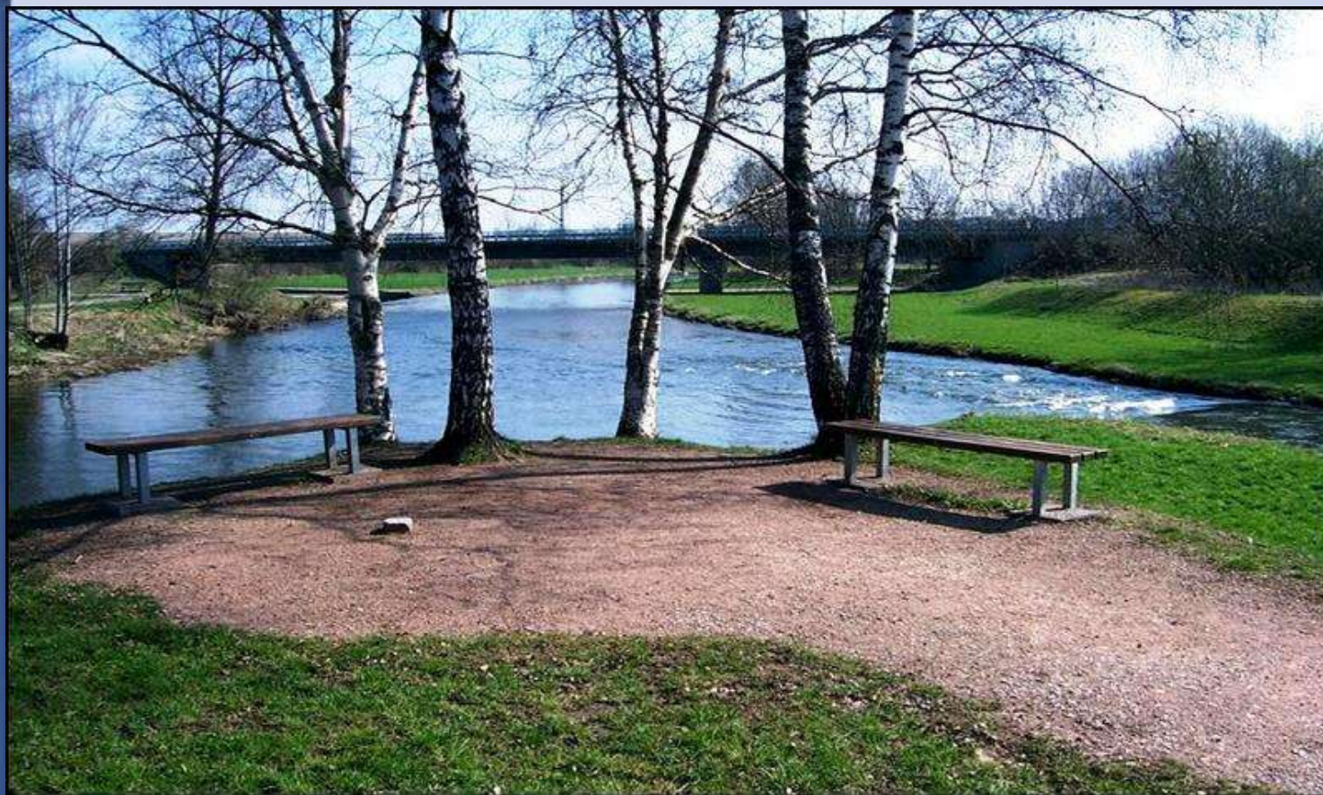
A Brigach (balról) és a Breg (jobbról) összefolyása és a Duna kezdete (középen) Donaueschingen-nél (Németország)