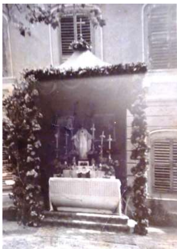
Körmeneti sátor a biliárdszoba előtt.