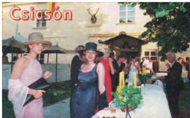
Előkelő vendégek – hercegi és grófi családok sarjai.