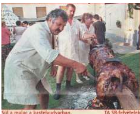
Sül a malac a kastélyudvarban.