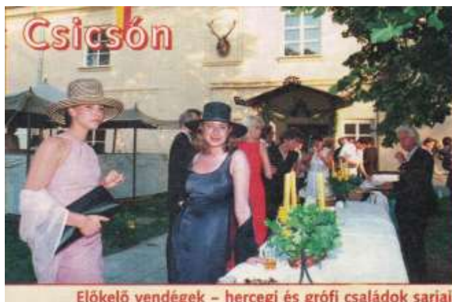
Előkelő vendégek – hercegi és grófi családok sarjai.