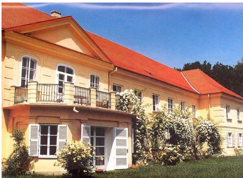
12/Csicsó kegyurai/Nagy Amália