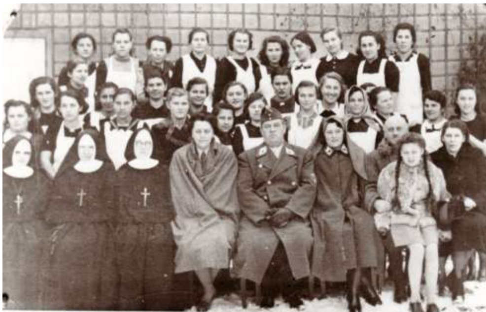
Vöröskeresztes tanfolyam, 1943, kastélypark- Rózsadomb.