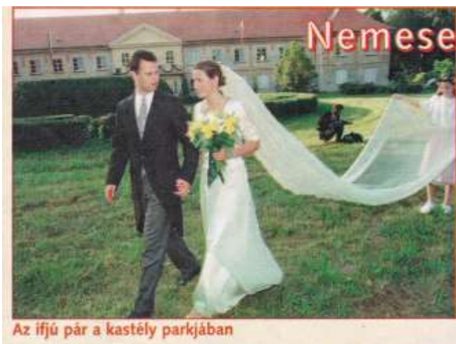
Az ifjú pár a kastély parkjában