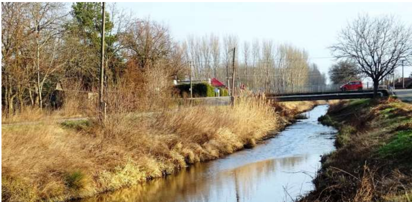
A Füssi-híd közelében lakunk.