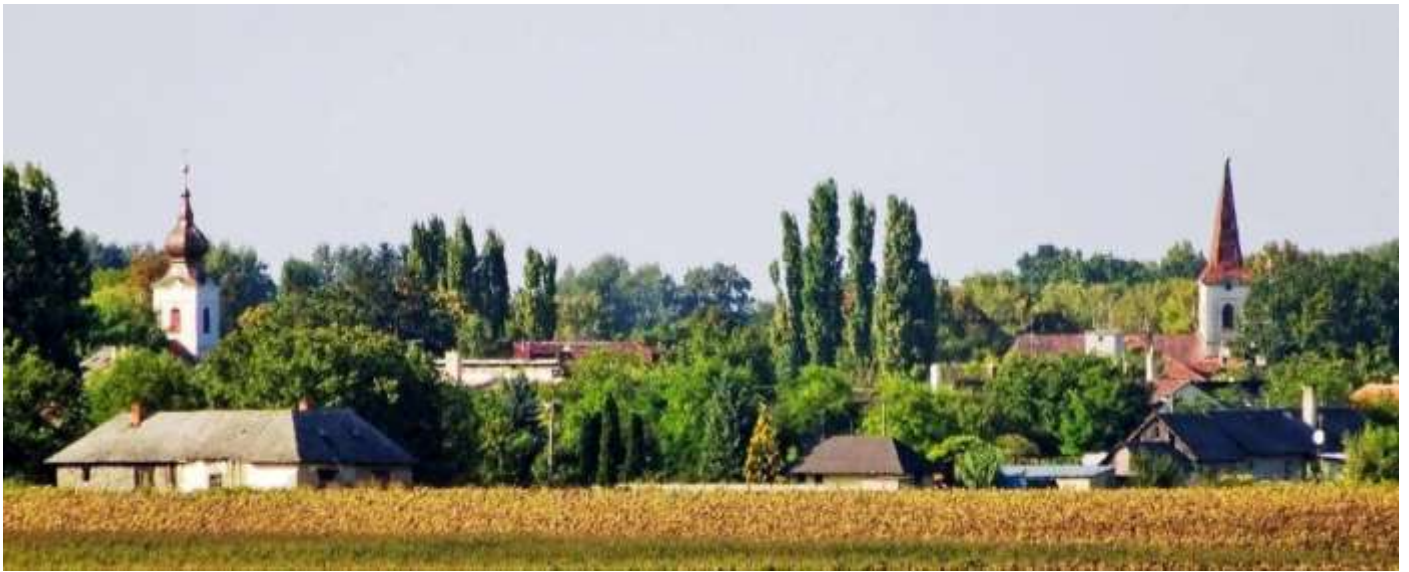
Csicsó látképe a Duna töltése felől.

Csicsó (szlovákul Čičov), az Alsó-Csallóközben, a történelmi Komárom vármegye nyugati határán, Nagymegyertől 11 km-re délre, a nyitrai kerület komáromi járásában fekszik a Duna bal partjának közelében.