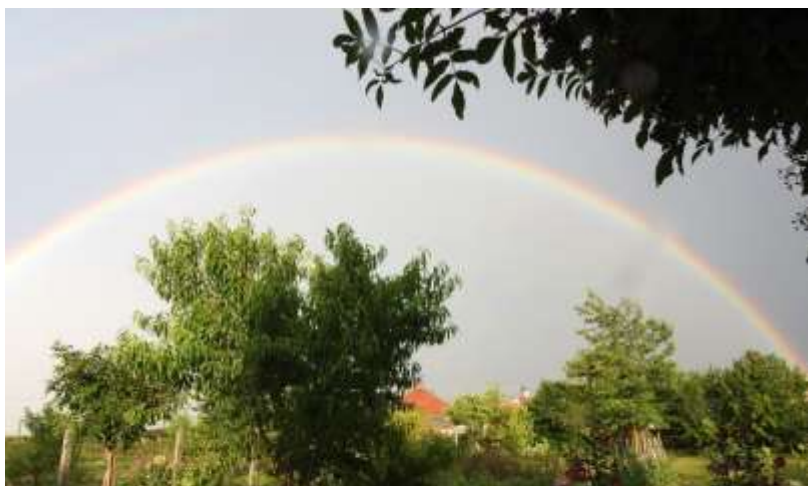
Szivárvány a kertünk felett.