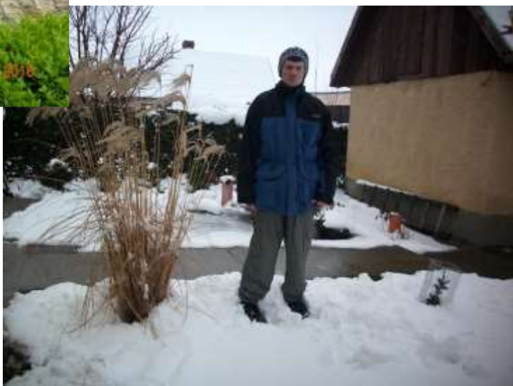
és télen, hóban.