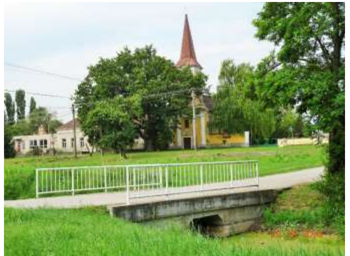
A római katolikus templomot és a zárdát is.