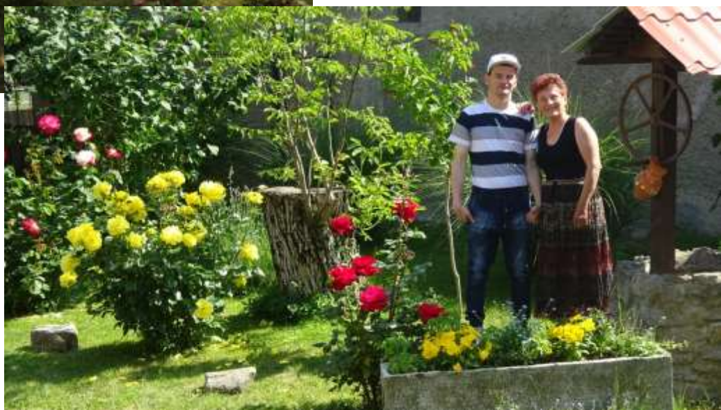
Édesanyámmal a nyíló rózsák között a díszkutunk előtt.