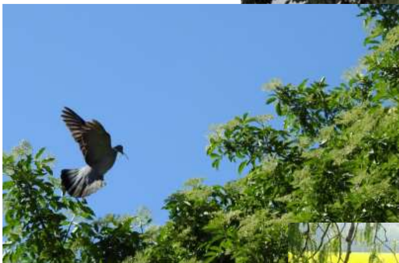
Tavaszi a kanális partján.